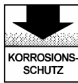
Защита от коррозии

*) FLV = лабораторный метод Fuchs Europe Schmierstoffe